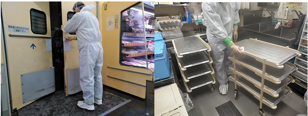
従業員出入口・作業場